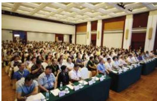
2019 年中国生物统计年会会场