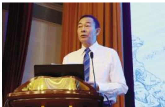
陈平雁教授致开幕辞